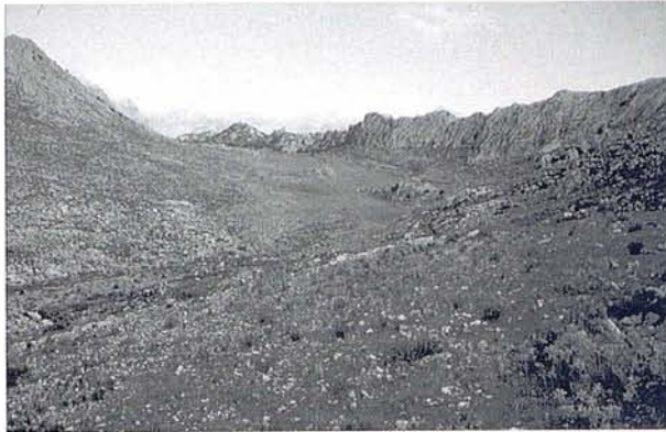
Foto 3: Depresión kárstica de sa coma de Son Torrella.

teoría del trop plein . En prospecciones realizadas en la zona alta del macizo, no se ha podido constatar la existencia de dolinas, depresiones o sumideros que justifiquen posibles puntos de absorción masiva. Existe una torrentera que pone al descubierto una fractura que va en la dirección de la Coma de Son Torrella y que viene a coincidir con la dirección general de la cavidad y con el alineamiento general de las fracturas y cabalgamientos que afectan a este sector de la Serra de Tramuntana, lo que apoyaría la teoría de la zona de alimentación de la cueva.