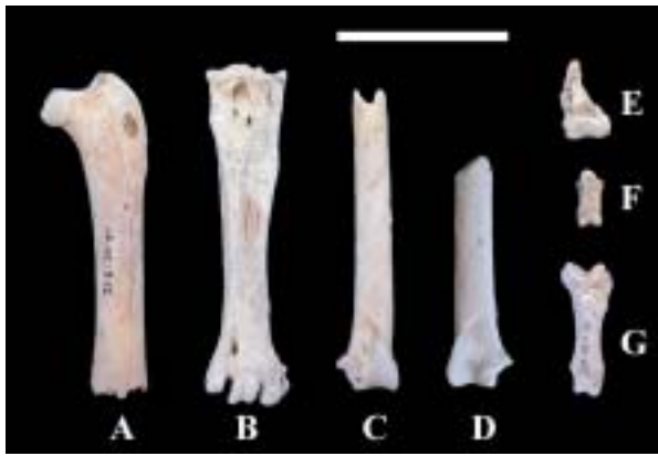
Figura 4: Ossos d' Haliaeetus albicilla de Formentera. A. Fèmur esquerre. B. Tarsometatarsià dret complet. C. Ulna dreta (fragment distal). D. Ulna esquerra (fragment distal). E. Os metatarsià I (hallux). F. Falange de dit posterior. G. Falanges fusionades 1 i 2 del segon dit posterior. Escala: 5 cm.