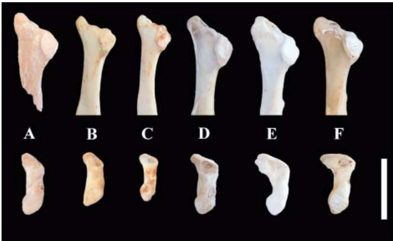
Figura 3: Escàpules de Aquila sp. de Menorca (A), Aquila chrysaetos MNIB 20500 (B), Aquila adalberti MNIB 20730 (C), Haliaeetus albicilla MNIB 21847 (D), Gyps fulvus MNIB 60079 (E) i Aegypius monachus MNIB 60145 (F). Normes lateral (a dalt) i cranial (a sota). Escala: 3 cm