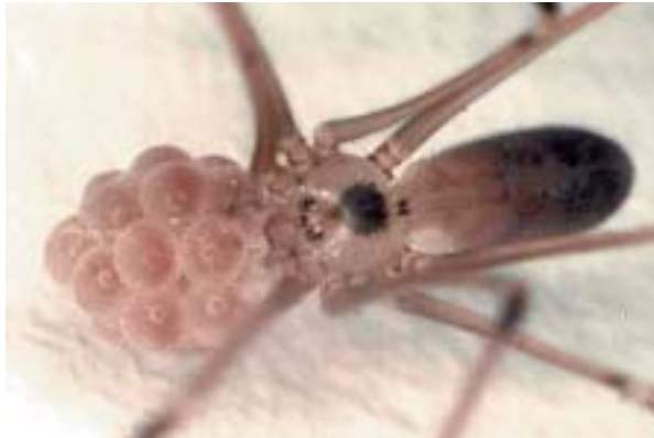
Figura 8. Pholcus phalangoides (Fuesslin, 1775) amb la posta.