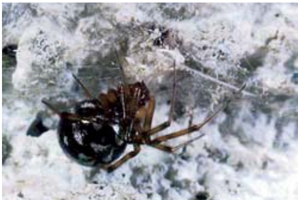
Figura 10. Steatoda triangulosa (Walckenaer, 1802).