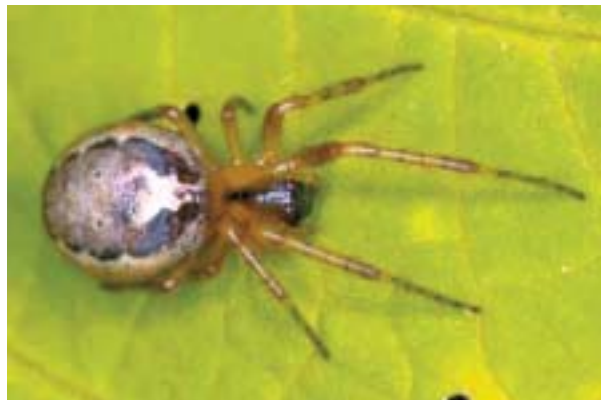
Figura 17. Zygiella x-notata (Clerck, 1757).