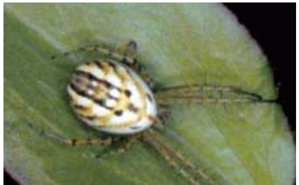
Figura 15. Mangora acalypha (Walckenaer, 1802).

Eivissa Es Pouàs, Santa Agnès de Corona (Sat Antoni), 01/11/90, 1 mascle. Col.: G.X. Pons. Cova des Vedrà (Sant Josep de la Talaia), 19/04/91, 1 femella. Col.: G.X. Pons.