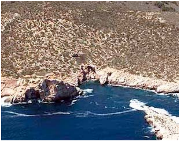
Figura. 2. Entrada a la cova des Burri davant l'illa de ses Bledes (Cabrera).