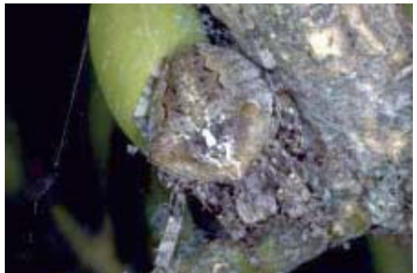
Figura 14. Araneus angulatus Clerck, 1757.