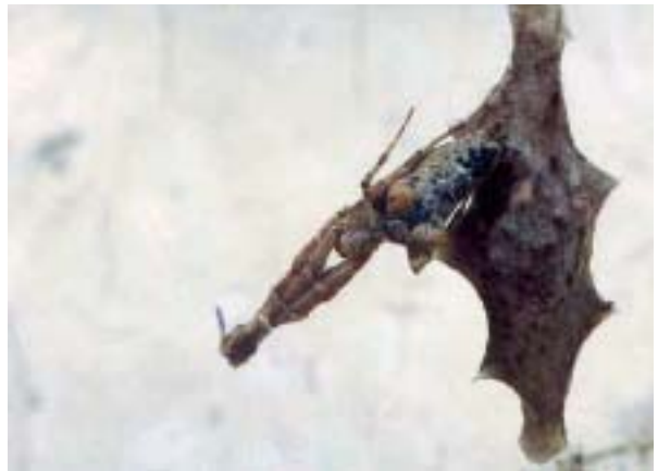
Figura 4. Uloborus plumipes Lucas, 1846