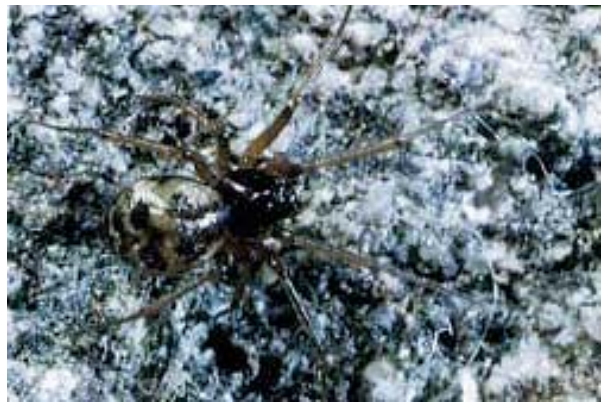
Figura 11. Lepthyphantes tenuis (Blackwall, 1852).

Distribució Euroasiàtica. Citada de Mallorca per BRISTOWE (1934; 1939; 1952) sense indicar localitat precisa i per ORGHIDAN et al. (1975) i de Menorca per FEBRER (1979), PONS i PALMER (1990).