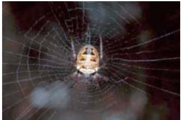
Figura 16. Zilla diodia (Walckenaer, 1802).