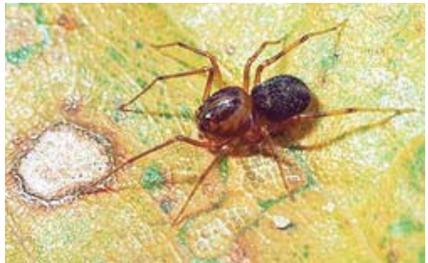
Figura 5. Scytodes velutina Heineken & Lowe, 1832.