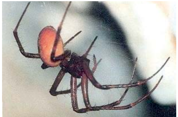
Figura 12. Meta bourneti (Simon, 1922).