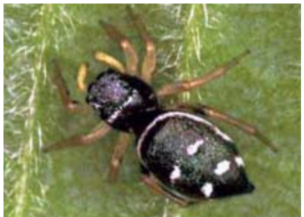
Figura 18. Heliophanus cupreus (Walck., 1802).