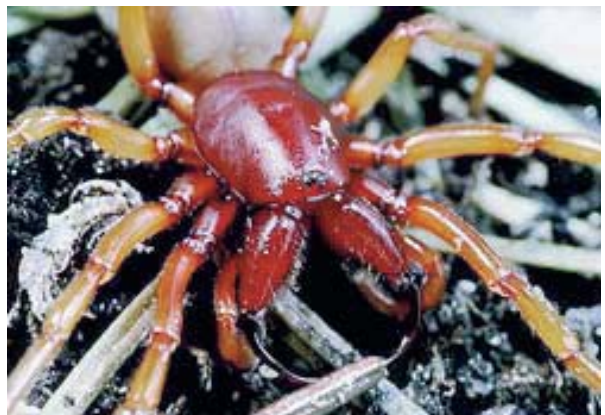
Figura 6. Dysdera crocota C. Koch, 1839.