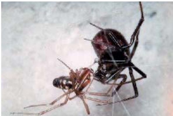
Figura 9. Steatoda grossa (C. Koch, 1838), mascle (més petit) amb la femella.