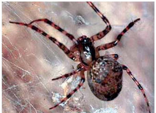
Figura 13. Metellina merianae (Scopoli, 1763).