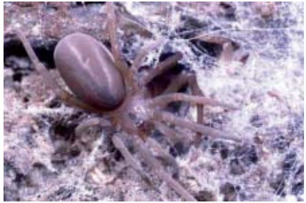
Figura 3. Filistata insidiatrix (Forsköl, 1775).

MNIB 776, Cova des Burri (Palma de Mallorca), 12/01/1991, 2 exemplars (2 juvenils), Col.: G.X. Pons.