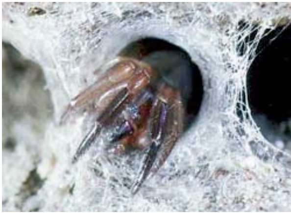
Figura 7. Ariadna insidiatrix Audouin, 1826.