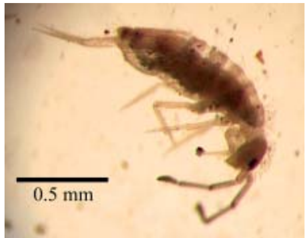
Foto 22: Vista lateral de la nueva especie de Entomobrya sp.

Photo 21: Dorsal view of a Lepthyphantes sp male.