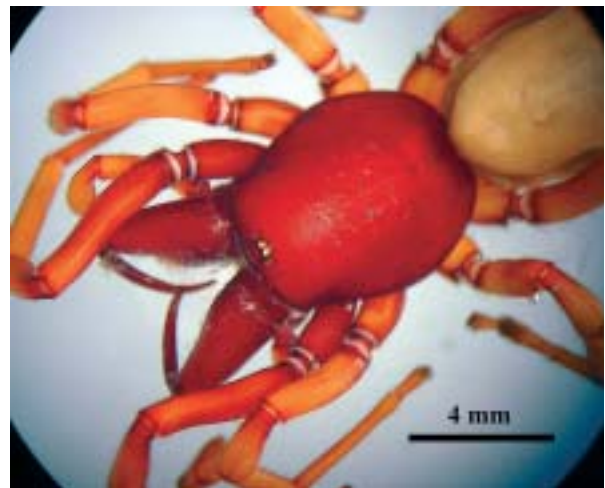
Foto 6: Detalle del cefalotórax de Dysdera crocata , pudiéndose observar sus grandes quelíceros (Foto M. Vadell).

Distribución cosmopolita. En Mallorca citada de la Cova dets Estudiants (Sóller), Cova dets Ases, Cova del Coll (Felanitx), Cova des Barranc des Sec (Calvià).