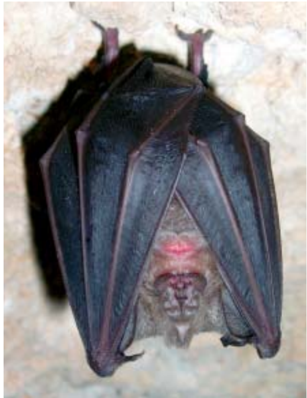
Foto 20: Vista ventral de Rhinolophus ferrumequinum.

El murciélago grande de herradura se extiende por Eurasia y el norte de África, a lo largo de una franja latitudinal que abarca desde el sur de Gran Bretaña, la Península Ibérica y Marruecos por el oeste, hasta Japón, Corea, China y Nepal por el este (C.B.C., S.L., 2003). Está presente en España a excepción de Canarias. En Castilla-León no se ha encontrado en la zona de Tierra de Campos. En Castilla-La Mancha no mues-