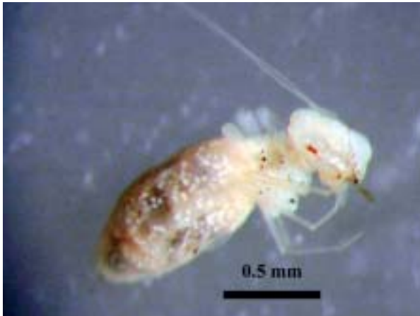
Foto 15: Vista lateral de una hembra de Psyllipsocus ramburii.

Photo 15: Lateral view of a Psyllipsocus ramburii female.