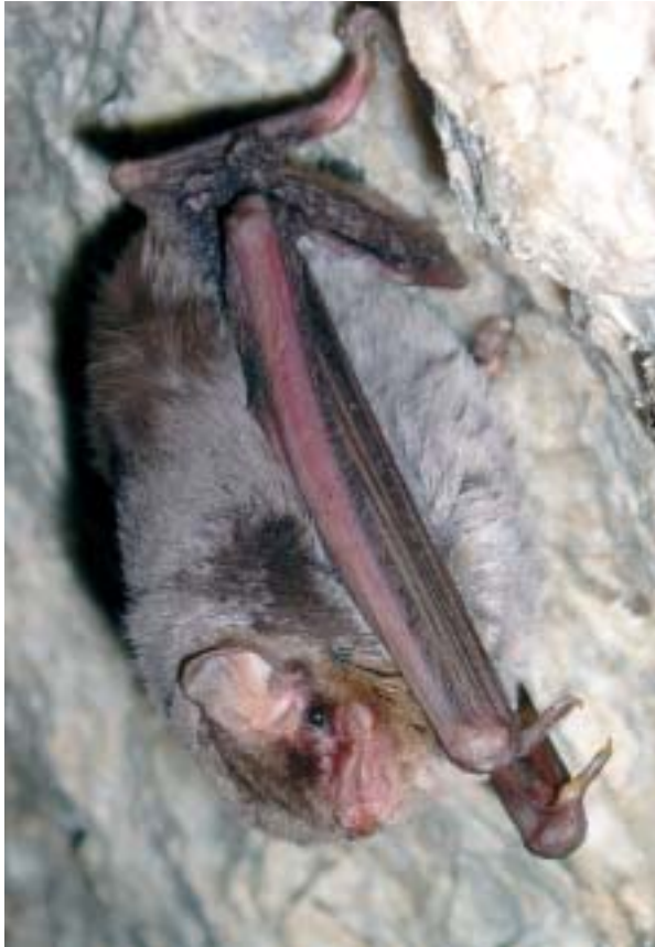
Foto 18: Vista lateral de Miniopterus schreibersi.

Fueron observados un par de ejemplares en dirección SE, al final de la Sala de ses Galeries inferiores, de las Coves del Pilar, el 23-X-2004 en condiciones de oscuridad total y alta humedad (Foto 17).