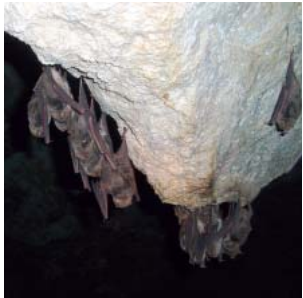
Foto 19: Pequeña colonia de Miniopterus schreibersi.

Conocido popularmente como murciélago de cueva. Pelaje de coloración pardo grisácea, más clara en el vientre. Longitud de cabeza y tronco de 50 a 62 mm con la cola de 56 a 64 mm, envergadura de las alas de 305 a 342 mm. Segunda falange del tercer dedo (último segmento) unas tres veces más larga que la primera, antebrazo de 42 a 48 mm, peso entre 10 y 15 gramos, cráneo muy abombado mientras su cara es bastante plana, con el hocico muy corto, orejas pequeñas, sin sobresalir de la cabeza, la configuración del conjunto de la cabeza es muy destacable, ya que la cabeza parece desproporcionada en relación al cuerpo (ALCOVER, 1979), (Foto 18).