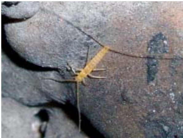
Foto 14: Ejemplar de Campodea (Campodea) majorica interjecta.

El ejemplar, de 18 mm y coloración amarilla pálida se capturó en la Sala de ses Galeries inferiors de las Coves del Pilar, debajo de piedras, en condiciones de oscuridad total y bajo índice de humedad.