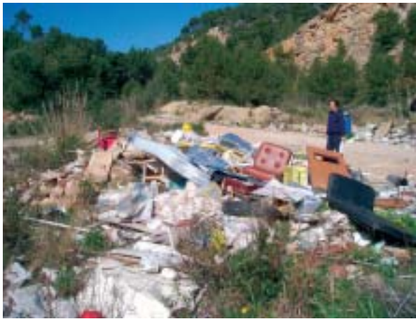
Foto 1: Camino de acceso a las Coves del Pilar, se pueden observar el acúmulo de basuras.

Photo 1: Access road to the Coves del Pilar. Accumulated rubbish can be seen.