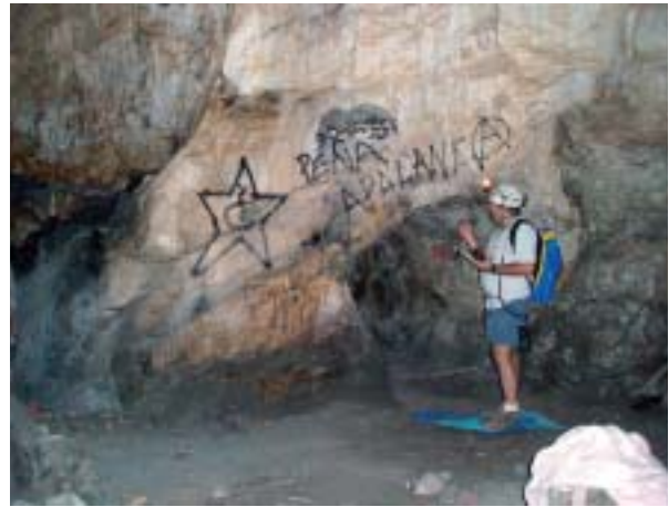
Foto 2: Sala del Pilar, una de las muchas pintadas que nos podemos encontrar en esta sala.

Photo 3: Details of the cephalothorax of Filistata insidiatrix.