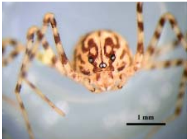
Foto 4: Vista frontal del cefalotórax de Scytodes thoracica.

Hembras con un tamaño de 2.5 mm y los machos de 1.7 mm. El cuerpo y las patas de color blanco, la parte torácica marcada por dos manchas de coloración olivácea mal definidas, opistosoma de forma globulosa marcado con algunos puntos oscuros de forma irregular. Los dos grupos oculares están separados uno del otro mucho más que su diámetro. En el macho los quelíceros están armados en su parte delantera de una pequeña punta negra cónica aguda, casi arqueado por debajo; la tibia del pedipalpo es por lo menos dos veces más larga que ancha y con forma convexa sobre todo en la base, finamente reducida a la extremidad. Apófisis del tarso larga, más gruesa, dirigida hacia abajo, dividida en tres ramas; la posterior es simple, obtusa, deprimida y de igual longitud que la base, saliendo un codo en ángulo recto, la apical brevemente pedunculada, dilatada a la extremidad y recubierta de muchos puntos agudos desiguales, el anterior submé-