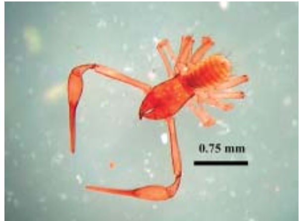
Foto 12: Vista dorsal de Chthonius (Ephippiochthonius) balearicus.

Mediciones y observaciones de los adultos capturados: Palpos, escudo prosómico y quelícero de un tono pardo-rojizo, el opistosoma y las patas con tono amarillento. Escudo prosómico 1.24-1.38 veces más largo que ancho en las hembras (1.54x en el macho), sin ojos ni manchas oculares, epistoma del escudo prosómico grande, triangular y agudo. Ratios de los palpos (longitud/anchura): fémur 4.53x (4.64x), patella 2.56-2.62x