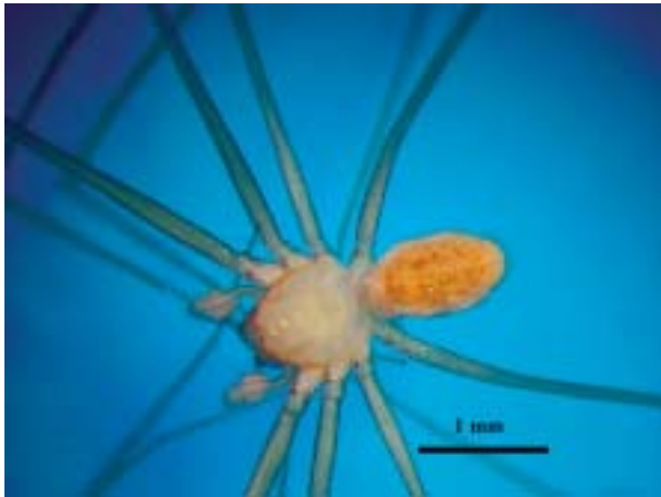
Foto 5: Vista dorsal de un ejemplar macho de Leptoneta infuscata , pudiéndose apreciar la regresión ocular.

Photo 5: Dorsal view of a male of Leptoneta infuscata , the ocular regression can be appreciated.