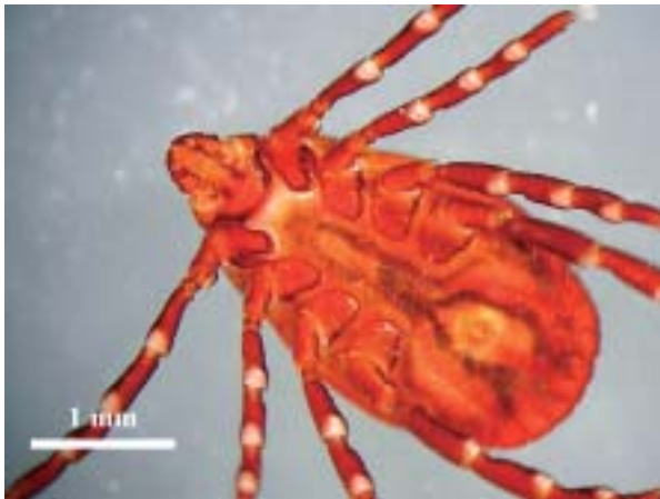
Foto 9: Vista ventral de un ejemplar hembra de Rhipicephalus sp.

Capturado un ejemplar adulto de unos 7.6 mm de longitud y 5.3 mm de anchura máxima, con una coloración marrón anaranjada oscura (Foto 8), a una veintena de metros de la entrada de la de sa Rampa de ses Columnes, con unas condiciones de ambiente seco y luz tenue.