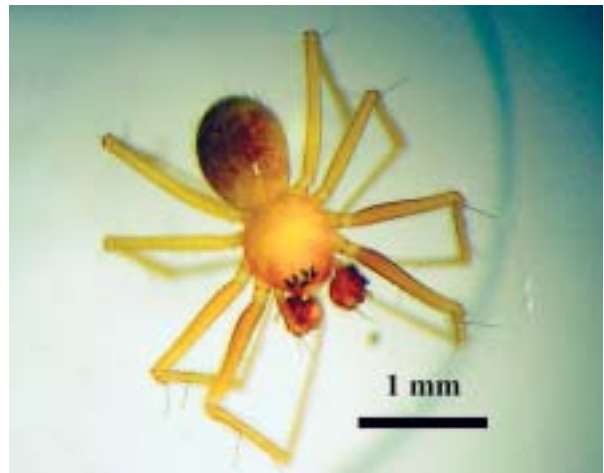
Foto 21: Vista dorsal de un ejemplar macho de Lepthyphantes sp.

Cuando se estaban terminando los últimos detalles de la topografía de las Coves del Pilar en la Sala de sa Rampa de ses Columnes, se observaron a unos 20 metros de la entrada natural y sobre unas columnas, unos colémbolos, de los cuales se recogieron varias muestras y se enviaron para su clasificación al Dr. Jordana del Departamento de Zoología y Ecología de la Universidad de Navarra, la sorpresa fue cuando el Dr. Jordana nos comunicó que se trataba de una especie