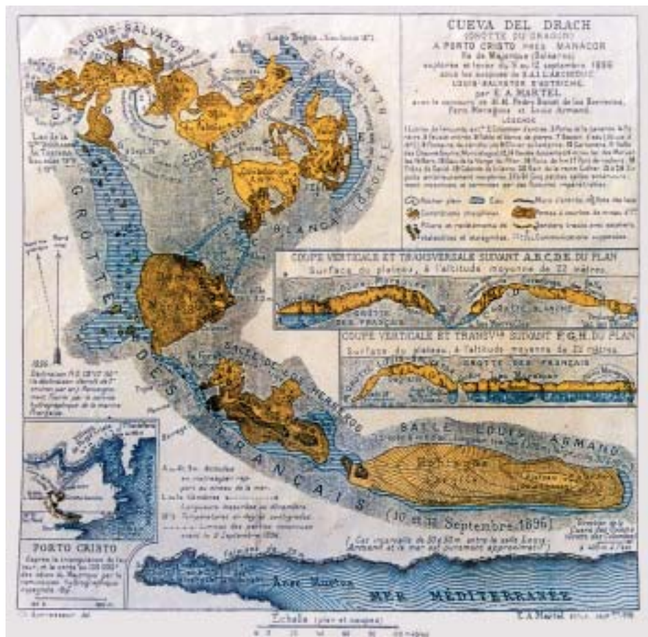
Figura 5: Plànol de les Coves del Drac, segons la exploració de Martel de l'any 1896.

Salvador und Lago de la Gran Duquesa de Toscana aus Wills Höhlenplan entfernt 12 .