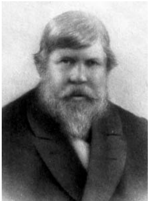
Abb. 2: Erzherzog Ludwig Salvator (1847-1915) Portrait.