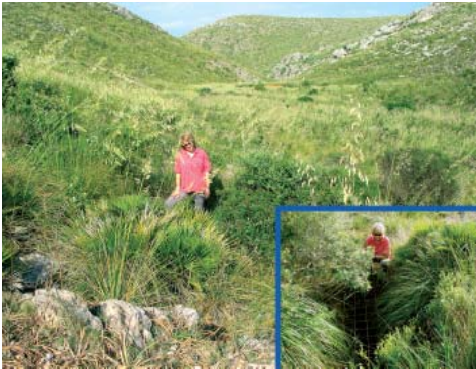
Foto 1: Aspecte del paratge on es localitza l'Avenc de na Corna (Artà) i detall de l'entrada d'aquesta modesta cavitat.