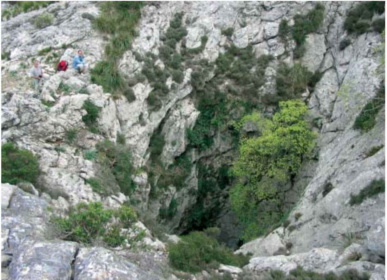
Foto 2: Aspecte exterior de l'Avenc de Femenia (Escorca) format per un únic gran pou de 120 metres de fondària. La glosa que fa referència a aquest avenc queda justificada amb escriure per l'espectacularitat de l'indret.