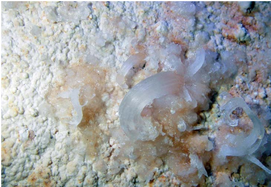
Foto 6: Conjunto de flores de Yeso ( cave flowers ) de formas irregulares. (Foto A. Merino).

variable de pétalos cristalinos que crecen desde un mismo punto y su composición química es de sulfato cálcico. Los pétalos, de diferentes longitudes y grosores, consisten en conjuntos de haces curvados que tienen un crecimiento de cristales paralelos. Las formas son muy variables y asimétricas lo que demuestra en parte la inestabilidad de su crecimiento. Las dimensiones del espeleotema son siempre muy reducidas, teniendo unos 2 o 3 mm las más pequeñas, hasta unos 10 mm las de mayor tamaño. Junto al espeleotemas se observa también una costra de apariencia cristalina que probablemente esté asimismo compuesta de yeso y de la que crecen algunas formas helicoidales de sulfato cálcico. Su génesis está ligada a la existencia sulfato