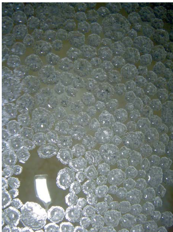
Foto 1: Conjunto de Burbujas ( cave bubbles ) donde se observan como la mayoría de individuos están bastante separados unos de otros apreciándose también su forma cristalina.

Es un espeleotema que ha sido hallado únicamente en un pequeño gour en el Sector del Clypeaster. Se trata de una concreción hueca de carbonato cálcico que flota precipitada sobre la superficie tranquila y quieta de un gour. Su forma es en general ovoide y alcanza unos 5 mm de diámetro. El gour donde fueron localizadas es de pequeño tamaño y su borde está totalmente forrado de cornisas ( shelfstone ). Al mismo tiempo en el fondo es posible observar el desarrollo de macrocristales de calcita y lo que parecen ser acumulaciones de calcita flotante ( cave rafts ) que se podrían corresponder con restos