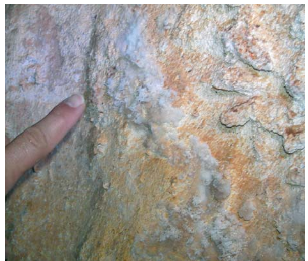
Foto 9: Aspecto de la pared de la roca donde se han desarrollado las flores de yeso.

Ya fue descrito en un anterior trabajo, cuando fue localizado en las Noves Extensions (MERINO, 2000), encontrándose principalmente en forma de bandas de nivel, como revestimientos subacuáticos lisos en los