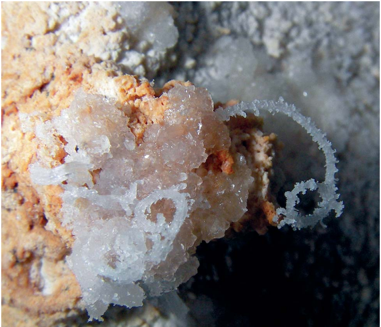
Foto 8: Espeleotema de forma helicoidal desarrollado desde una costra de yeso depositada sobre la pared de la roca.