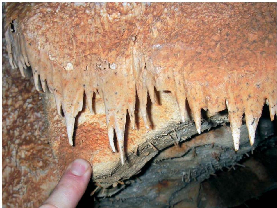
Photo 5: Ochre colouroured sandsicles hanging completely from a wall.