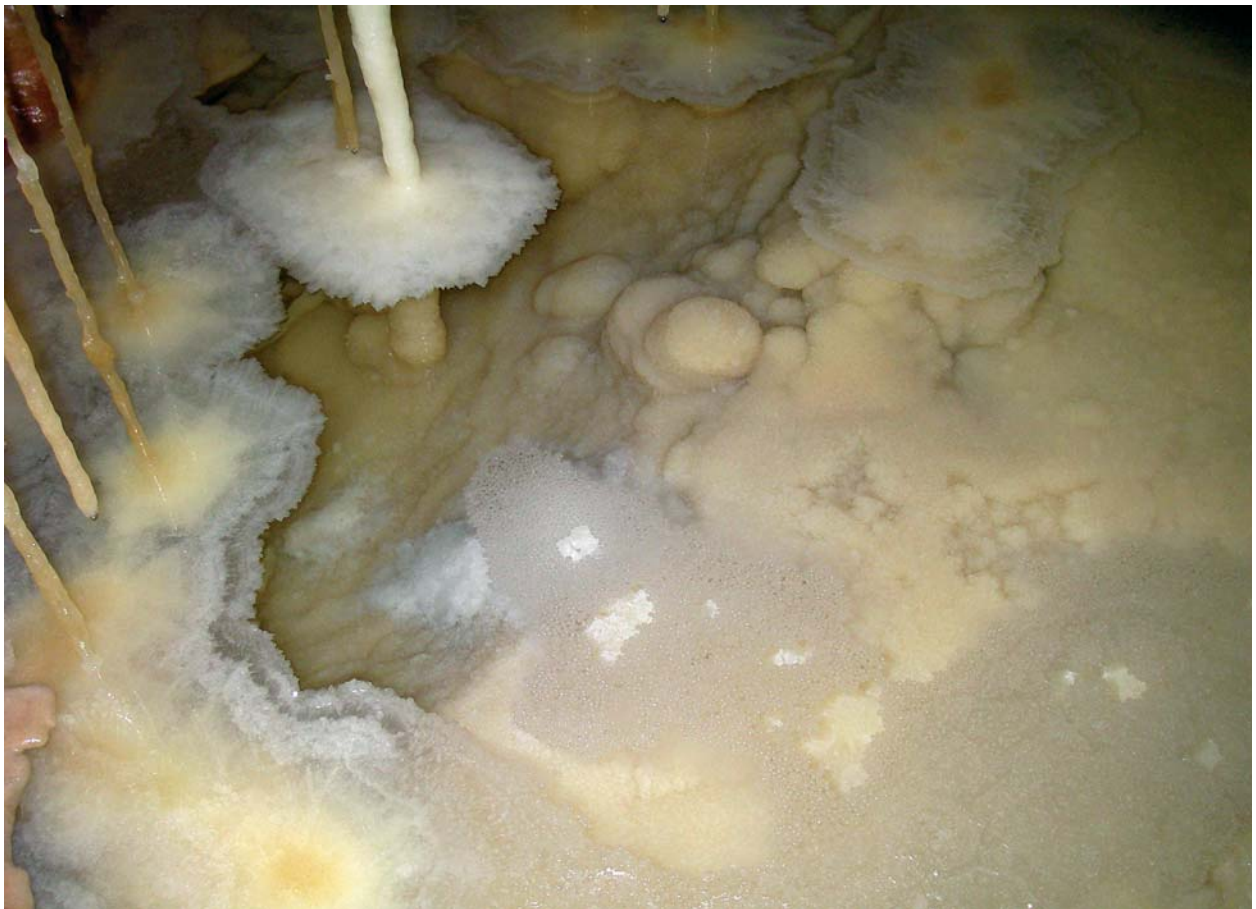
Foto 3: Vista general del sector del gour donde se formaron las Burbujas ( cave bubbles ). Es posible observar no sólo como se mantienen flotando las Burbujas, sino también Cornisas ( shelfstone ) adosadas a los límites del gour y macrocristales de calcita que cubren el fondo y las paredes de la cubeta.

de burbujas que han perdido su flotabilidad y se han hundido quedando allí sedimentadas. Todos estos hechos indican un ambiente altamente saturado en bicarbonato cálcico. El conjunto de burbujas está compuesto por centenares de individuos, muchos de ellos pegados al borde del tour. Otros ejemplares se sitúan en el centro de la masa de agua pero se mantienen en contacto con los primeros. La morfología de lo que son las burbujas en sí es bastante uniforme, estando su tamaño totalmente supereditado al de la cazoleta sobre la que descansan. Esta precipitación de carbonato cálcico tiene una variedad de formas que van desde individuos casi circulares a otros que se aproximarían a un hexágono. En detalle es posible observar la existencia de un cierto ordenamiento de microcristales. Existen grupos de individuos que están claramente separados unos de los otros por pequeños espacios llenos de agua, mientras que hay otras asociaciones que presentan una mayor densidad de individuos rellenándose el espacio intersticial con un precipitado de carbonato cálcico. Al mismo tiempo, en el límite de estas agrupaciones de burbujas "soldadas", se observa una especie de nebulosa compuesta probablemente de pequeños cristales precipitados de calcita que pueden ser los responsables de que finalmente las burbujas queden adheridas unas a las otras.