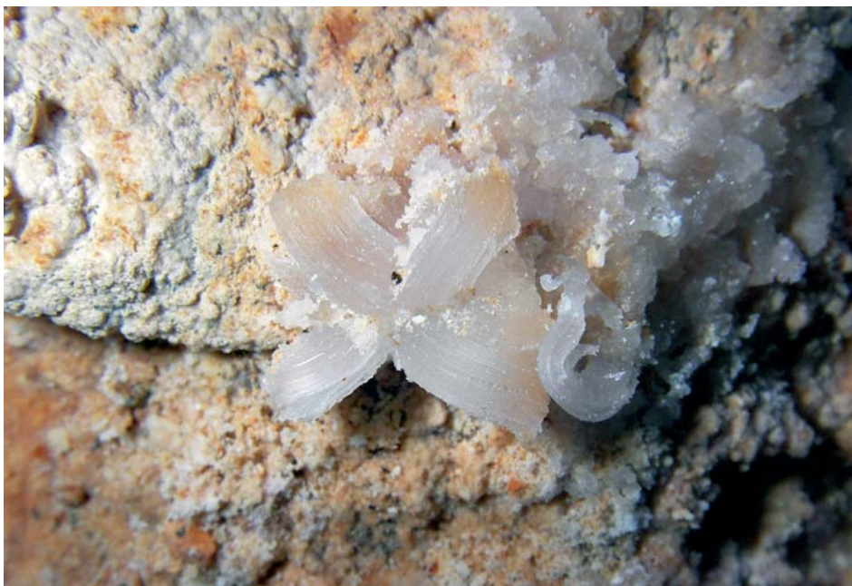
Foto 7: Flor de yeso ( cave flower ) de cuatro pétalos.

Photo 6: Group of gypsum cave flowers of uneven shapes.