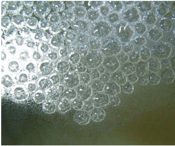
Foto 2: Grupo de Burbujas ( cave bubbles ) completamente soldados unas con las otras, formando prácticamente una unidad. En la parte inferior de la foto, y pegado al límite del espeleotema se observa la nebulosa de pequeños cristales de calcita que flotan sobre el agua del gour.